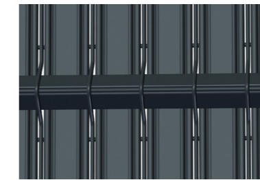
Profilé en "V"